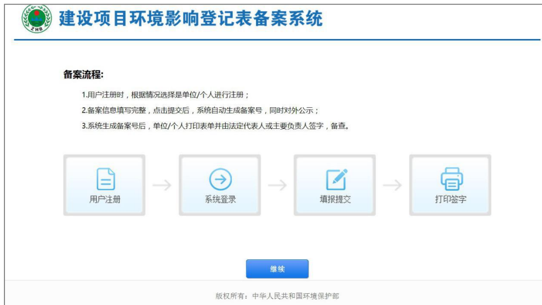
图 11 向导页