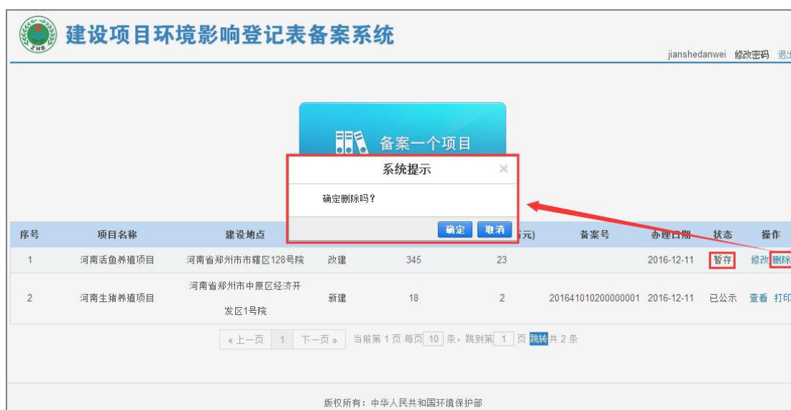
图 36 删除