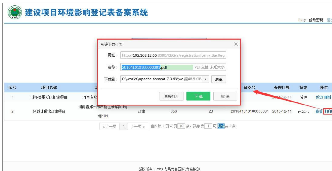
图 54 打印