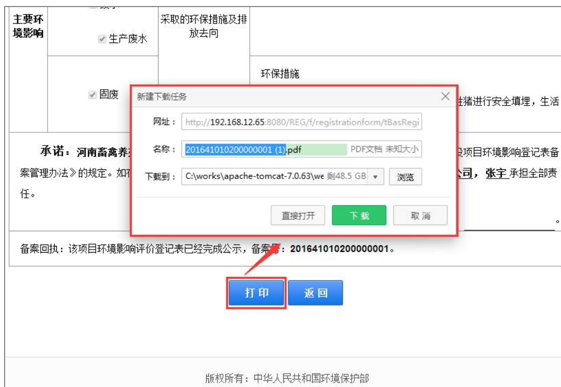
图 33 打印

11. 点击【打印】按钮，将登记表下载到本地，法定代表人签字备查，点击【返回】按钮，返回数据列表，项目的状态显为“已公示”，如下图：