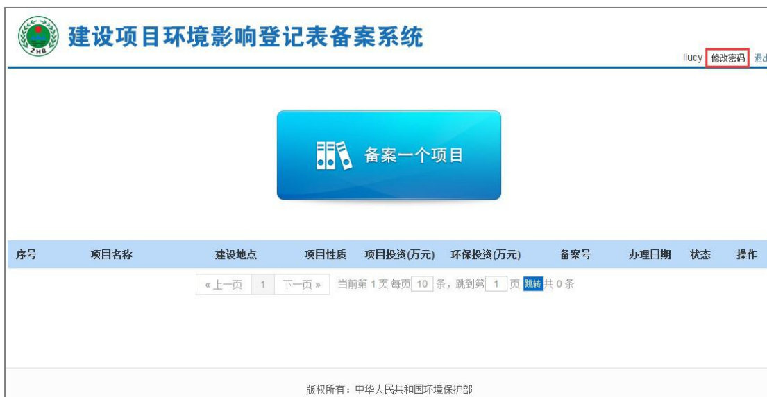
图 20 修改密码