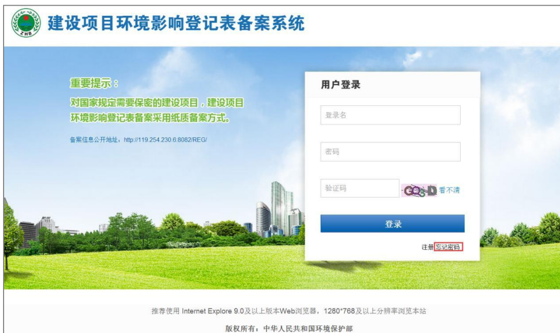
图 15 忘记密码