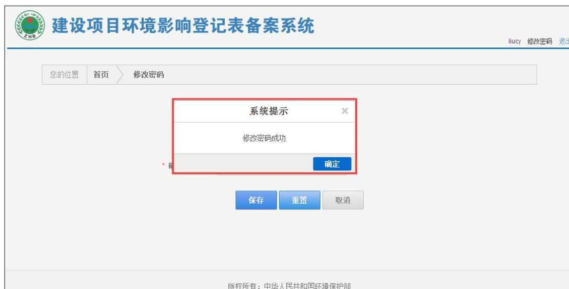
图 22 密码修改成功