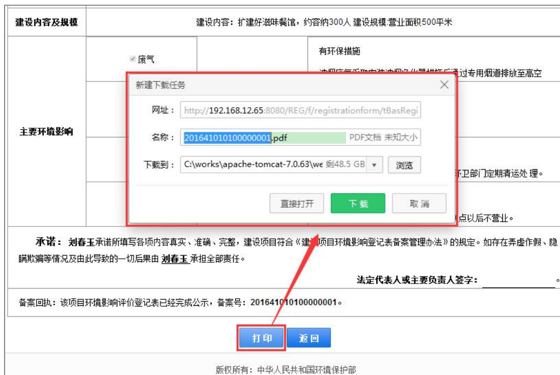
图 49 打印