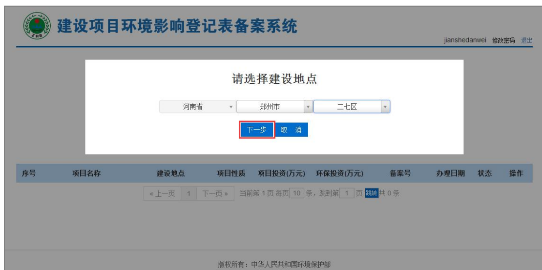
图 24 选择建设地点