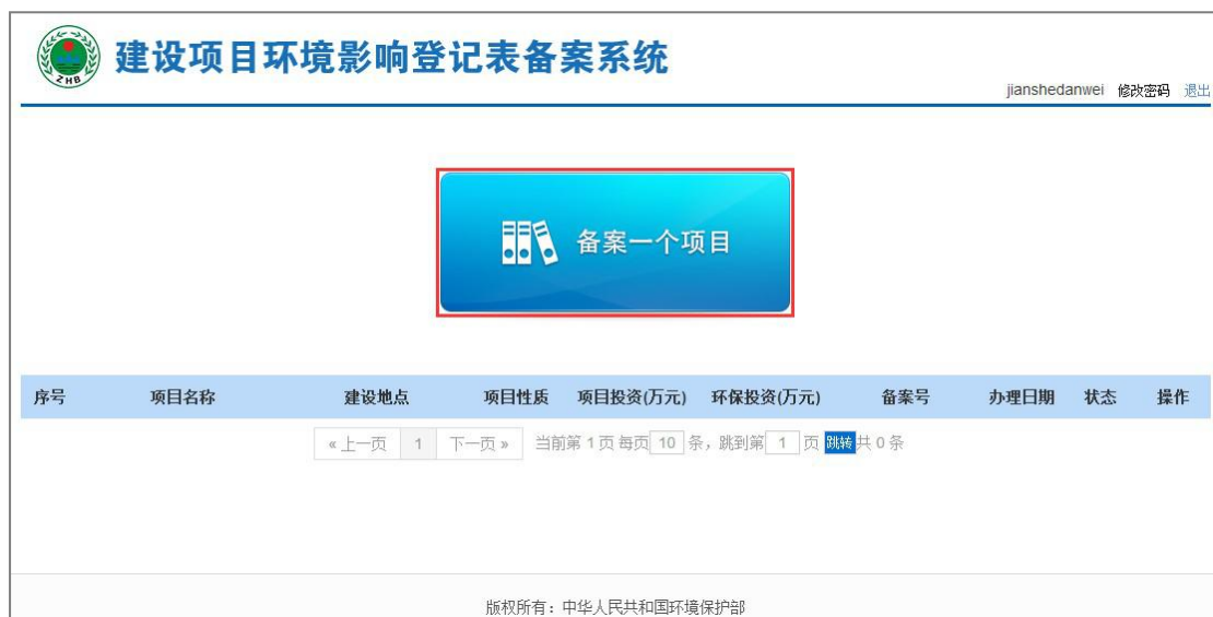
图 23 备案新项目