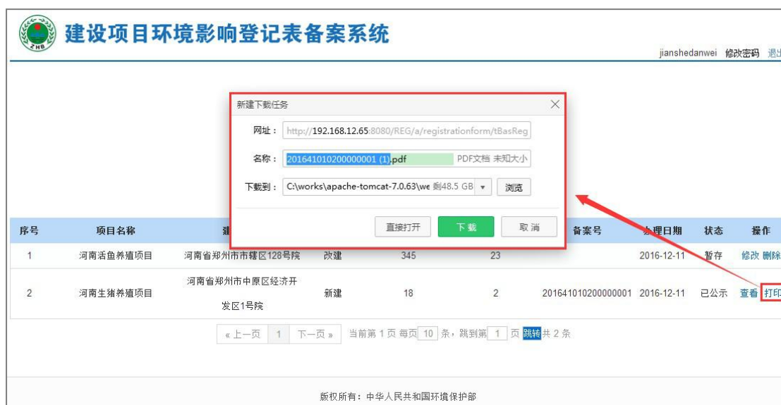
图 38 打印