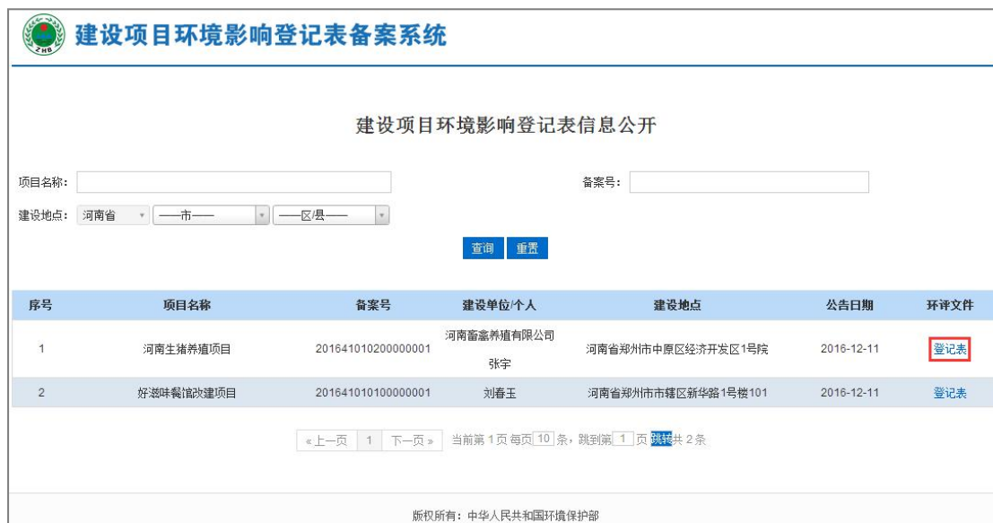
图 57 查看列表

4. 进入登记表查看页面，查看登记表的详细信息，点击【返回】按钮，返回公式列表，如下图：