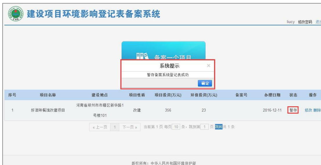
图 45 项目列表

注：“暂存”后的项目可以在项目列表中点击修改后，进行提交。详细步骤参考第 4.2.2 章节。