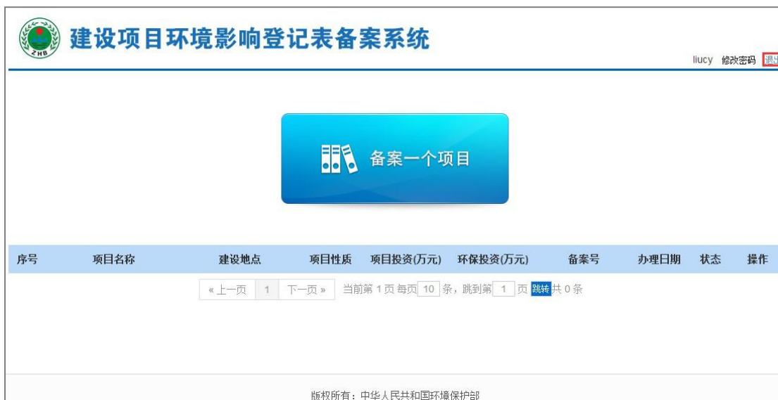
图 14 备案项目列表