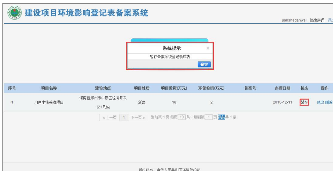
图 29 暂存

注：“暂存”后的项目可以在项目列表中点击修改后，进行提交。详细步骤参考第 4.1.2 章节。