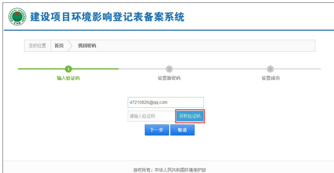
图 16 填写邮箱