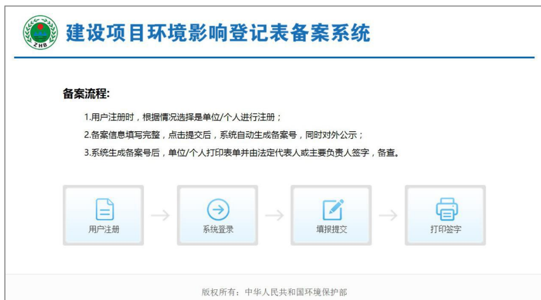
图 1 向导页