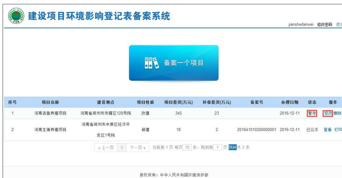
图 35 修改