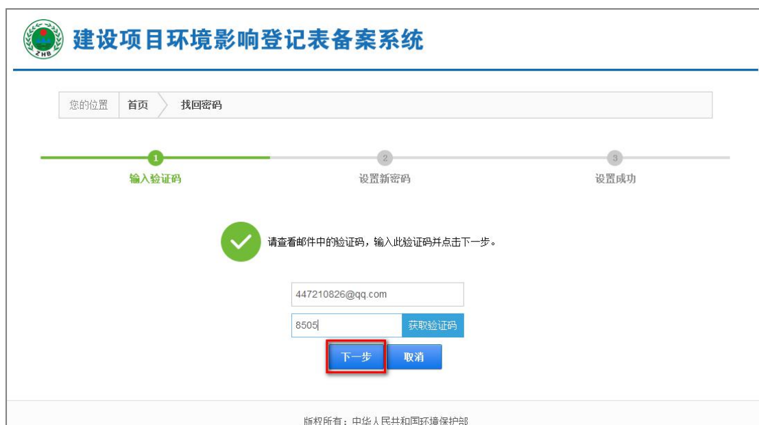
图 17 输入验证码