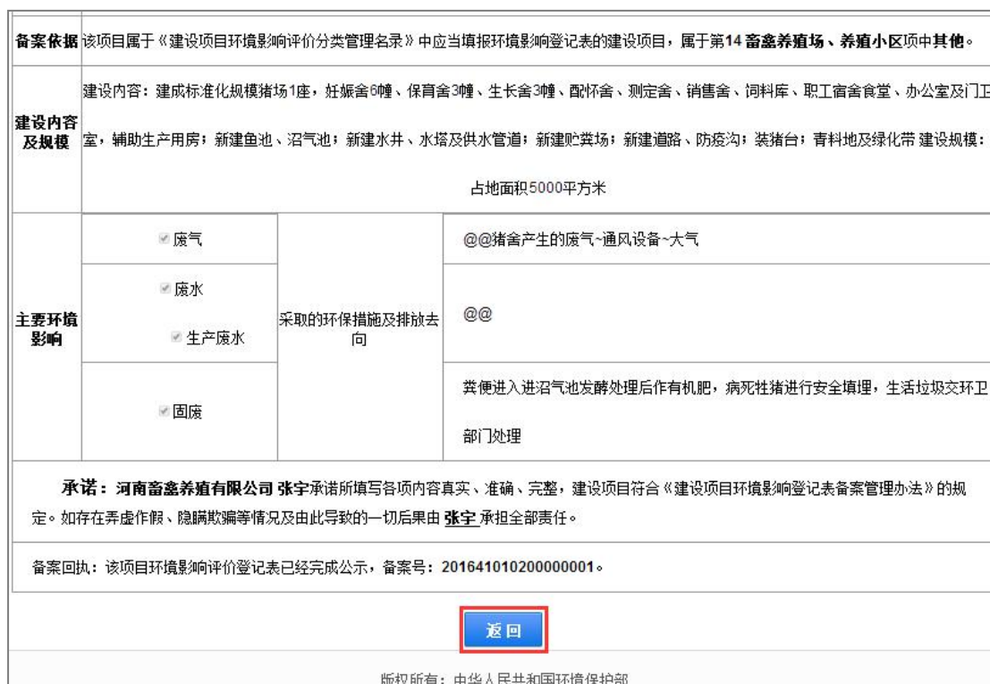
图 58 查看详细信息

4. 进入登记表查看页面，查看登记表的详细信息，点击【返回】按钮，返回公式列表，如下图：