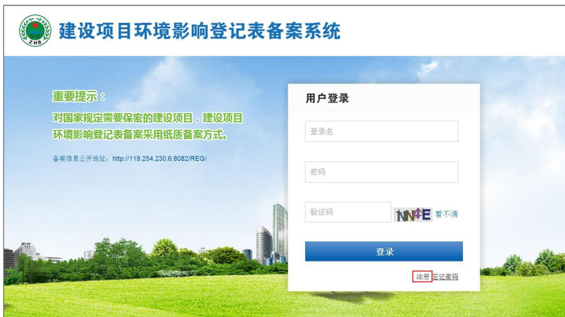
图 8 个人注册首页

4. 进入用户注册页面，注册类型选择“个人”，进入个人注册页面，填写相应的必填信息，点击【注册】按钮。