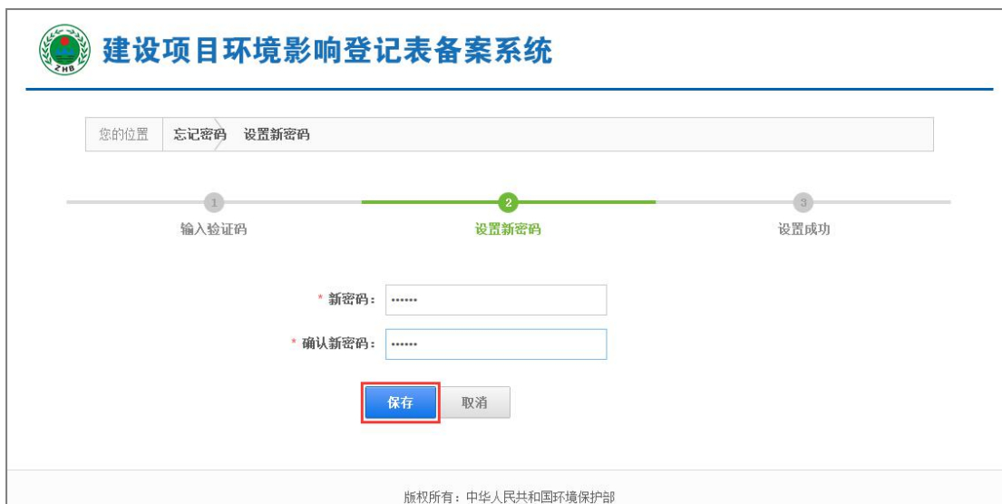
图 18 设置新密码