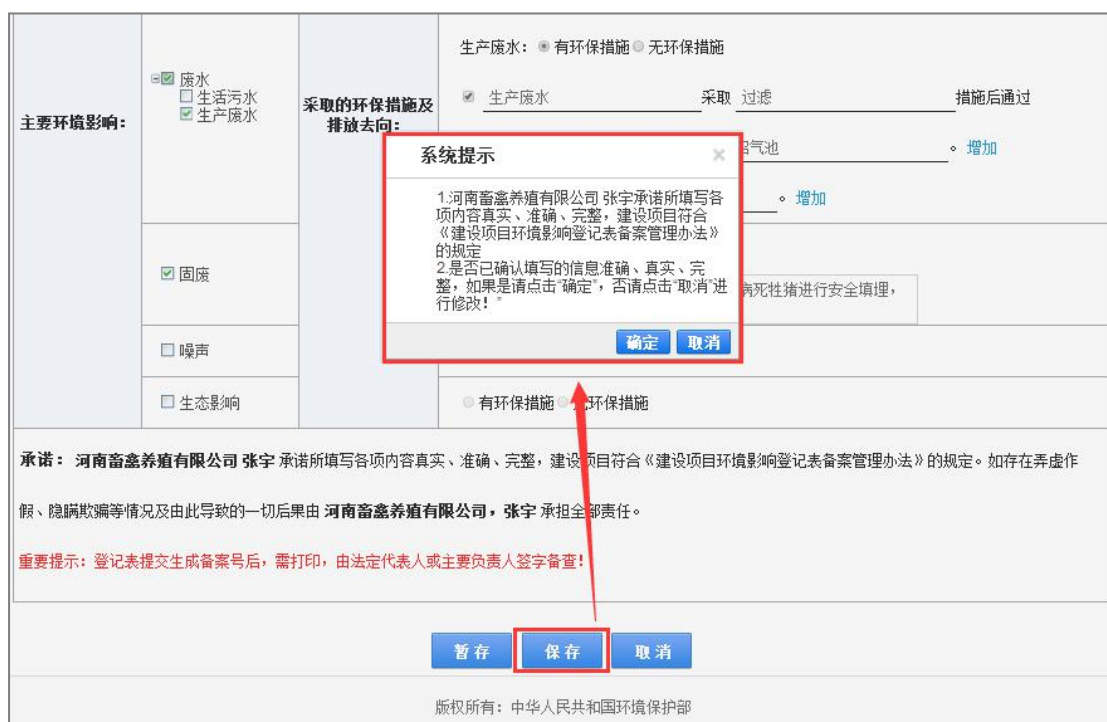
图 30 保存项目

8. 点击【保存】按钮，弹出确认提示框，用户需仔细阅读提示信息，在提示框上点击【确定】按钮，如下图：