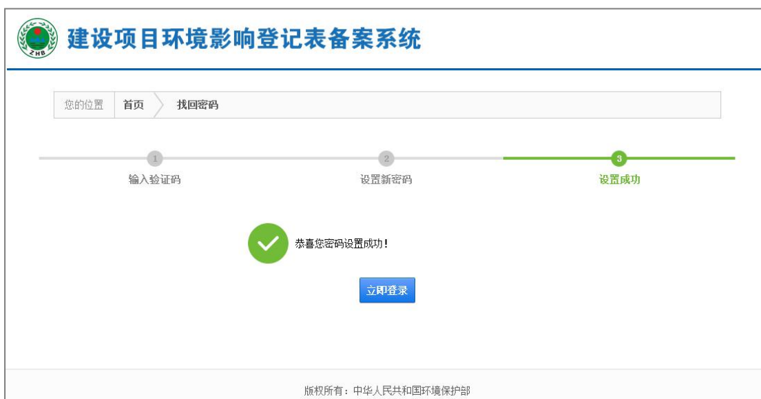
图 19 密码设置成功