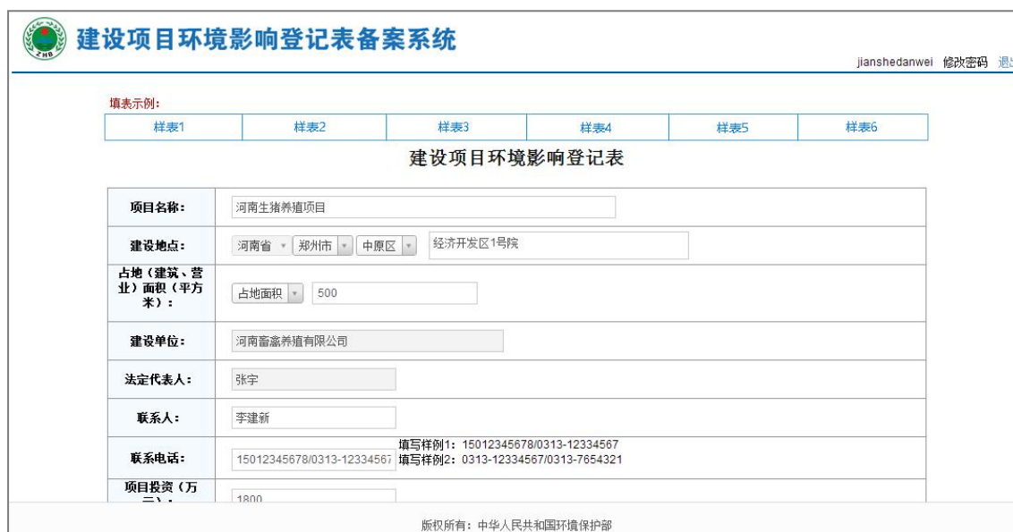
图 42 登记表填写-1