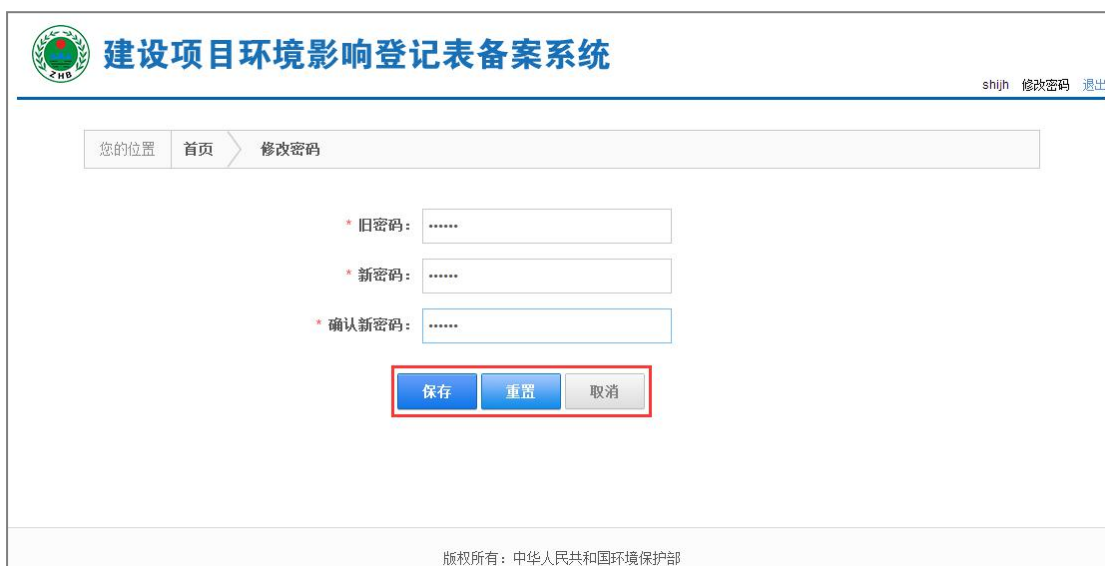
图 21 设置确认新密码