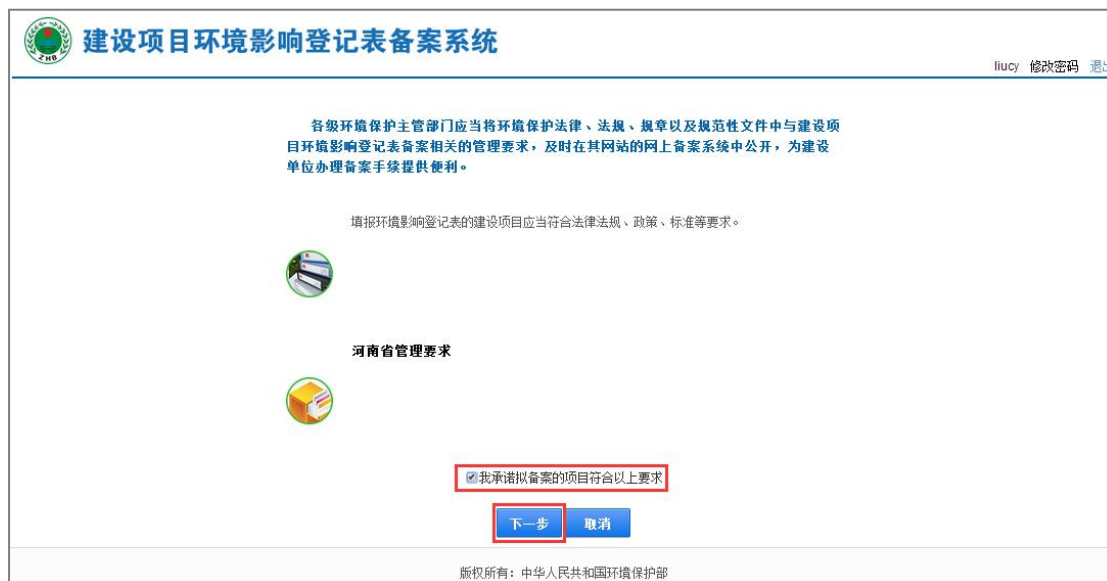
图 41 环保要求