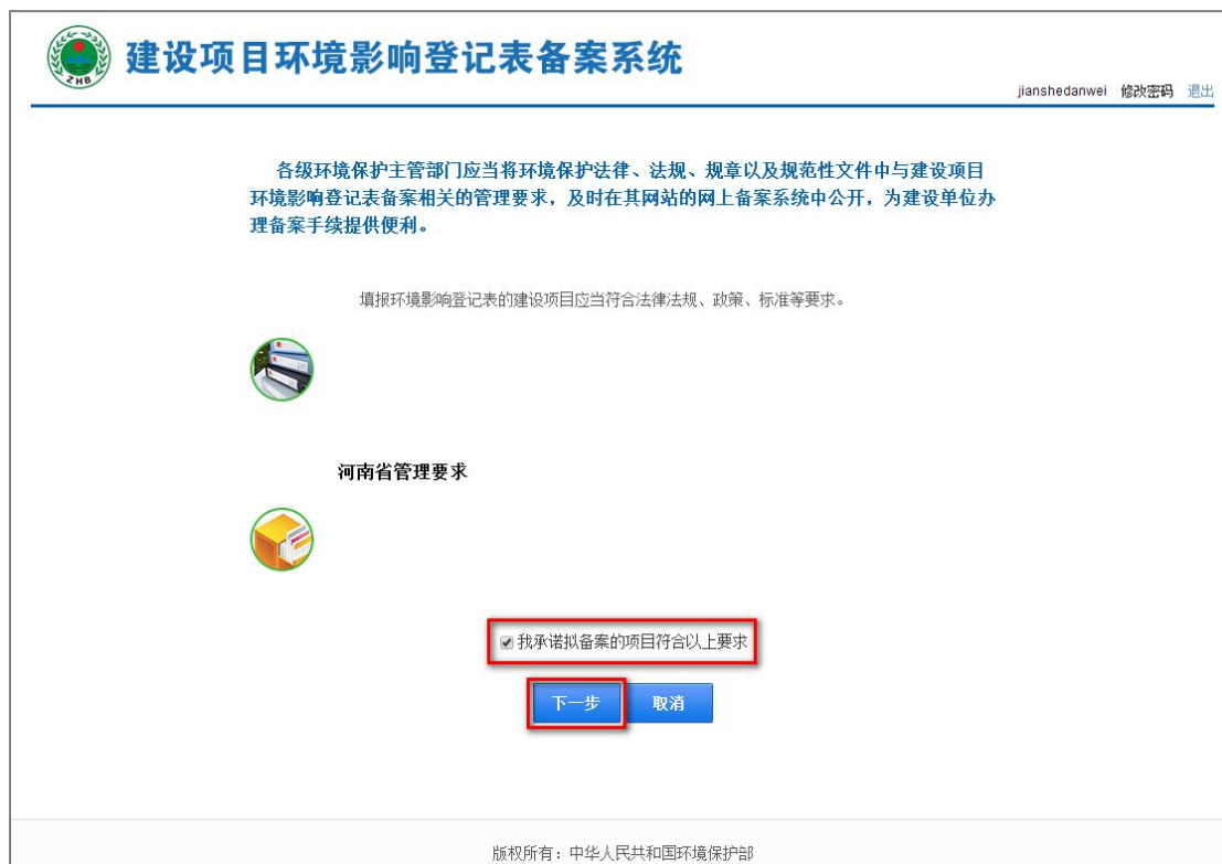
图 25 备案环保要求