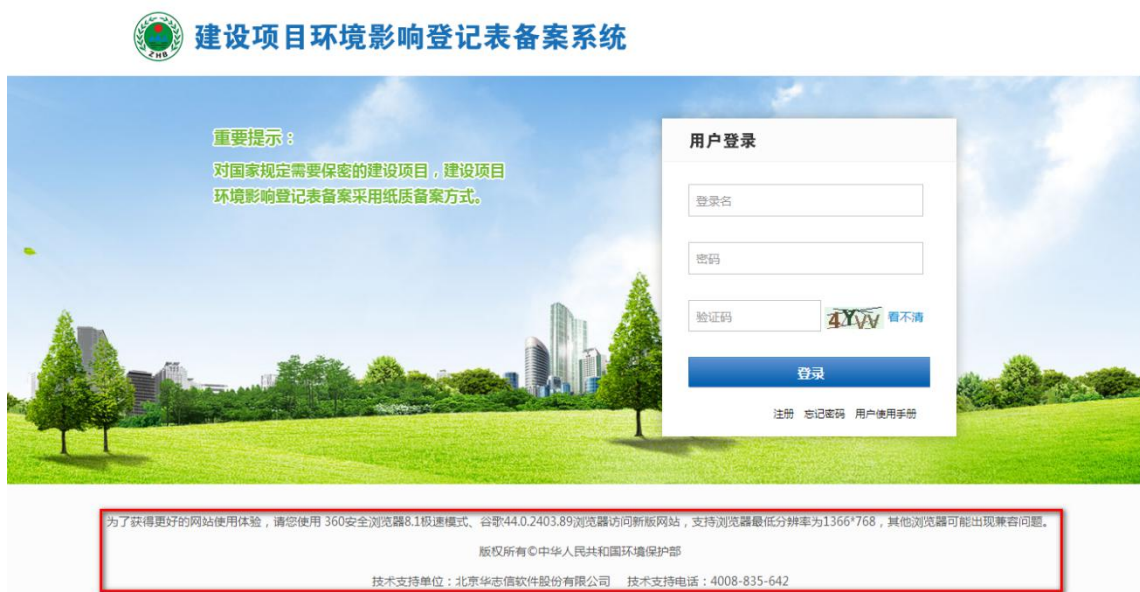
图 13 登录