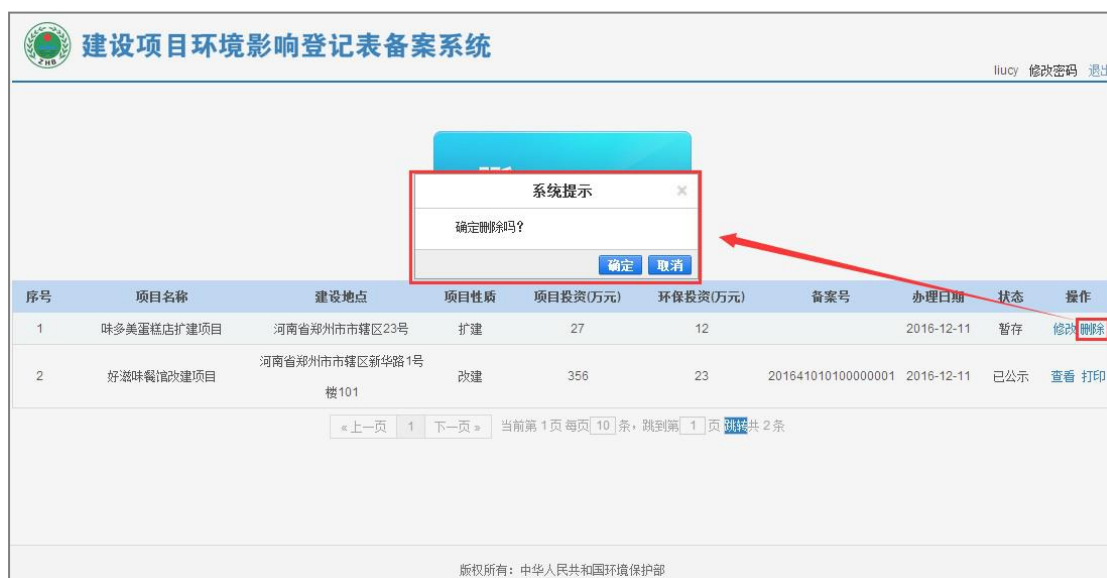
图 52 项目删除