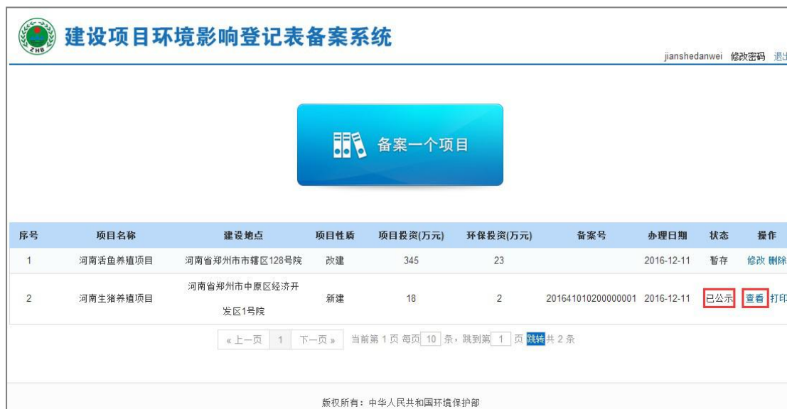
图 37 查看