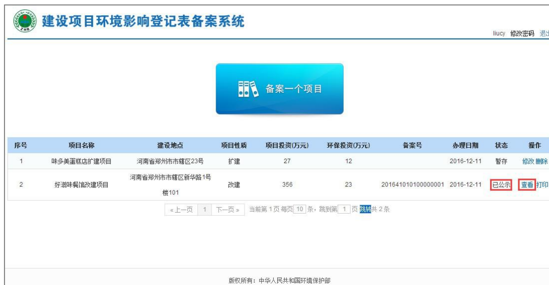
图 53 项目查看