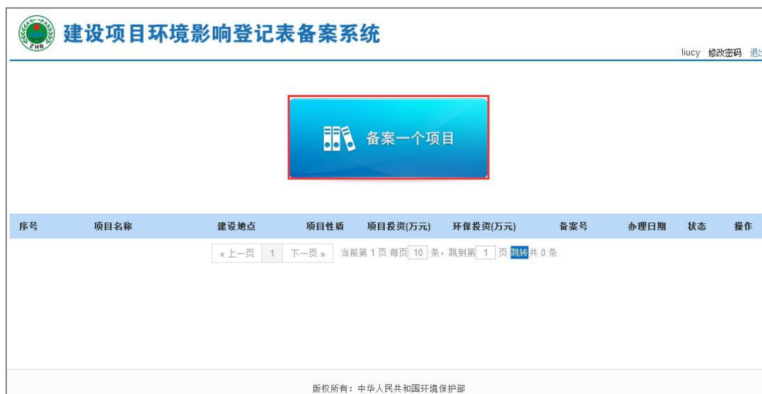
图 39 备案新项目