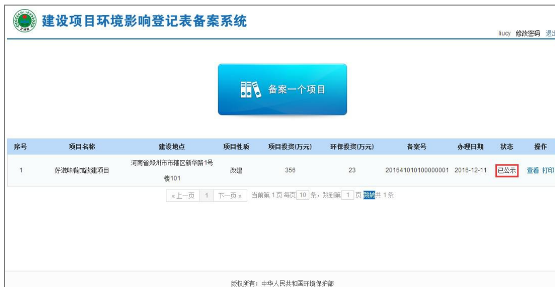
图 50 返回列表