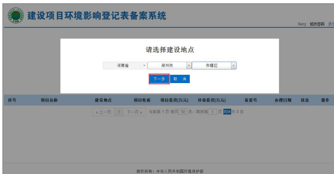
图 40 选择建设地点