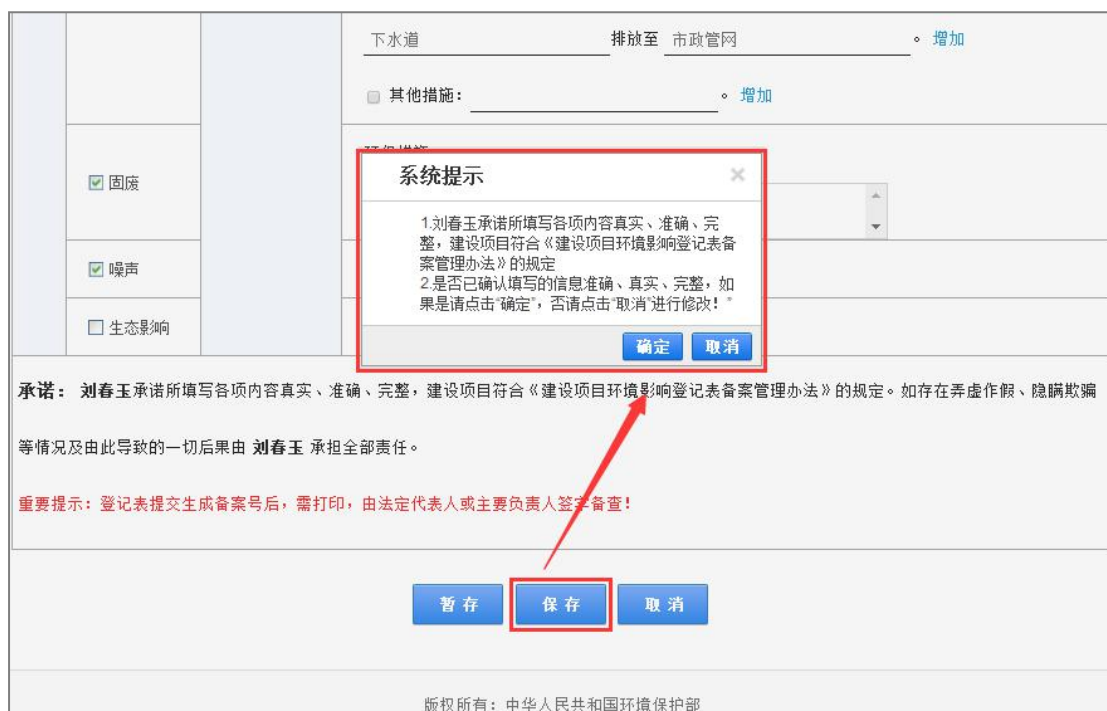
图 46 项目保存