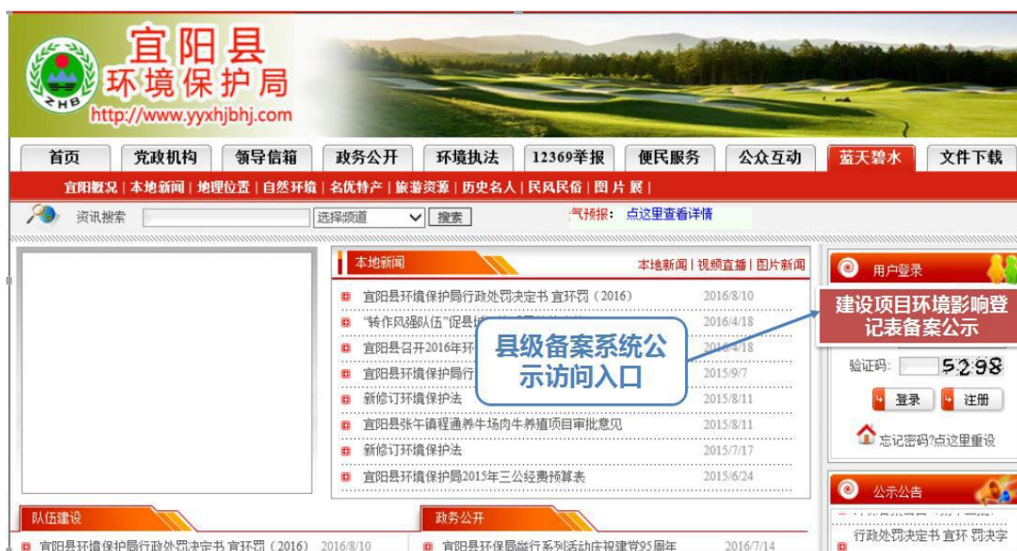
图 55 公示入口