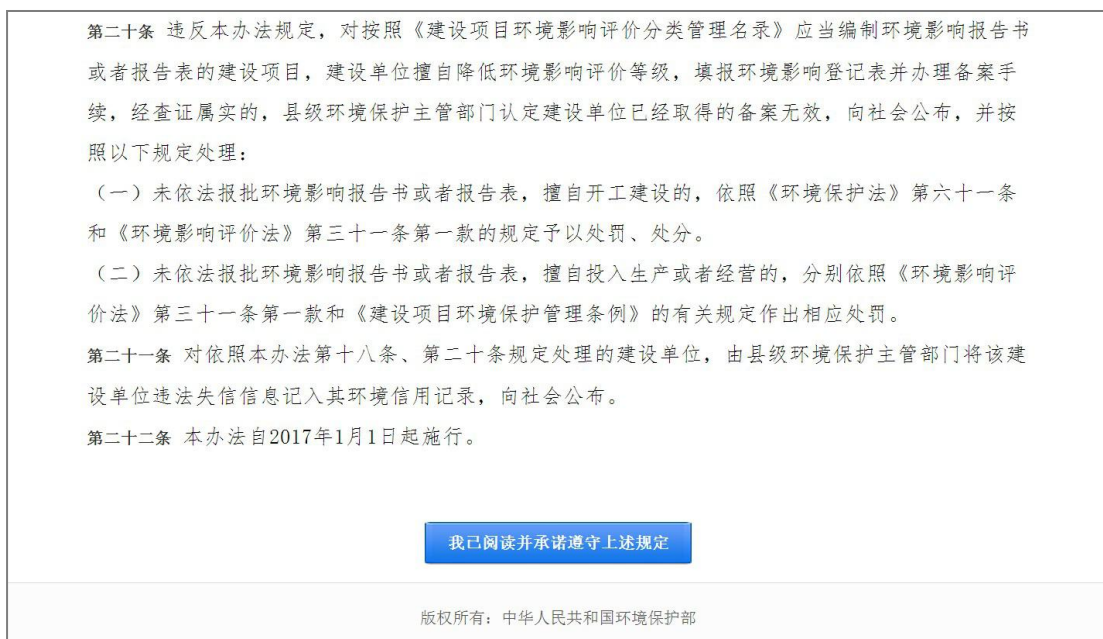
图 7 备案管理办法