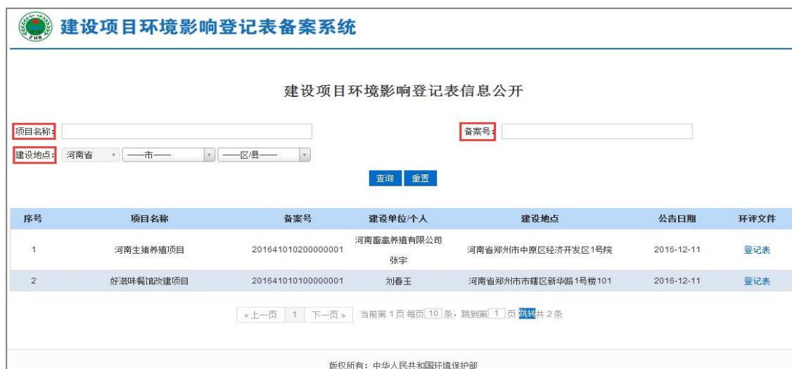
图 56 公告页面