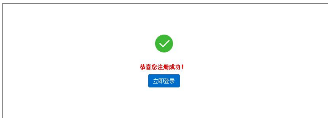
图 5 企业注册成功