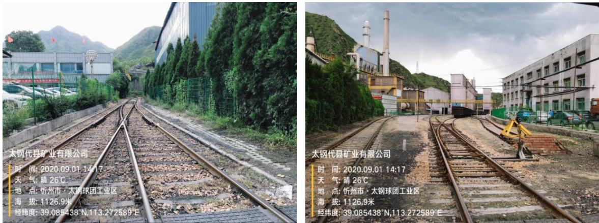
图 1 大宗物料专用火车